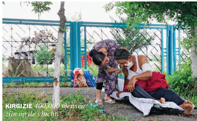
KIRGIZIË 400.000 mensen zijn op de vlucht.

Nederland schat zijn aantal dak- en thuislozen op meer dan 35.000, en toch leven er in de grote Nederlandse steden bijna geen meer op straat. Dat meldt het Trimbosinstituut in zijn jaarrapport. Volgens hen lag de oplossing bij persoonlijke hulptrajecten.